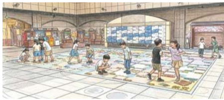
▲すごろくマップイメージ