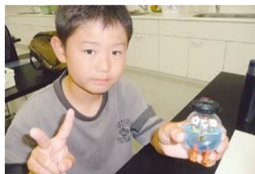
▲コンピュータボードを作ろう