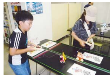
▲リモコンで動くロボットを作って遊ぼう