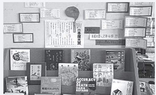
▲青戸中学校の学習センター(学校図書館)の様子

学習センター活用推進アドバイザーや学校図書館コーディネーターを教育委員会事務局に配置し、子どもたちが本に親しむ機会や授業における探究的な学習の充実等について各学校を支援しています。