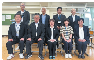
写真はふれあいスクール明石の先生方の一部です。このほかに、多くの先生が関わっています。

ふれあいスクール明石では、通室している児童・生徒一人一人に担当指導教授と心理専門員がつき、それぞれに合った進路選択や将来的な社会的自立につながるようサポートしています。「長い間学校を休んでいて、学校に戻ることが難しい」「教室や集団での生活が苦手だが、少人数なら通えそう」と感じている場合は、まずご相談ください。