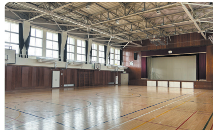
体育館：思いっきり体を動かせます