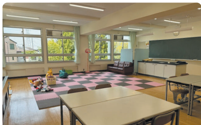
ふれあいルーム：リラックスして過ごす部屋です