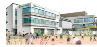
▲(仮称)子ども未来プラザ白鳥のイメージ

計 子ども未来プラザの整備 約4億5,700万円 子育て支援の拠点となる子ども未来プラザを新たに整備し、妊娠から子どもが成人するまでの支援に取り組むとともに、配慮を必要とする子どもや保護者への支援を充実させます。