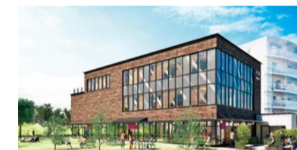
▲柴又川 かわら まちなみ館のイメージ

計 電有・柴又地域観光拠点施設活用推進事業 約2億3,100万円 こち亀記念館や柴又川 かわら まちなみ館を中心として、地域のより一層のにぎわい創出につながる魅力ある事業を実施します。