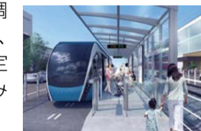
▲新交通システムのイメージ

計 新金線を活用した新たな交通システムの整備 約2億5,800万円 新金線用地の調査や設計を行い、事業化計画の策定に向けて取り組みます。