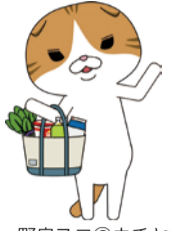
野良スコ