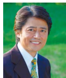
【講師】 たいら いさお氏 (童謡歌手)

唱歌・童謡・歌謡曲・外国曲を歌って学びます。 日 5月7日～6月25日の(木)午前10時～正午 対 区内在住65歳以上の方56人 費 2,300円 方 オンライン申請か、往復ハガキ（「2面上欄記入事項」を記入）で、4月20日（月）（必着）まで（新規申し込み優先・多数抽選）。 会 申 担 〒124-0012立石6-38-11シニア活動支援センター内地域包括ケア担当課 ☎03-5698-6202