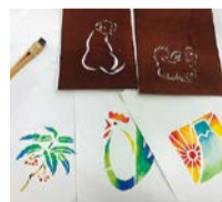
▲伊勢形紙 (布バッグに柄付け)