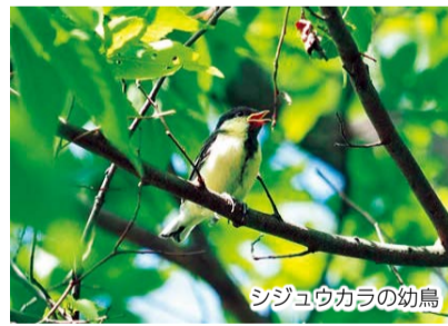
シジウコカウの幼鳥