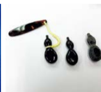
▲江戸べっ甲 (根付け作り)