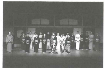
9月7日(日) 葛飾区立文化センター 葛飾区日本舞踊大会 会場入り前