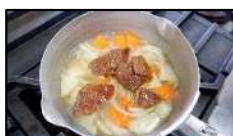
肉・調味料を入れて煮ます