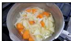
野菜は油で炒め煮ます