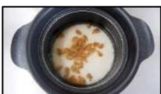
あさりを入れる前にしっかり米に吸水させましょう