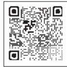
公共施設予約システム