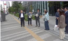
⑤しんみち通りの見学