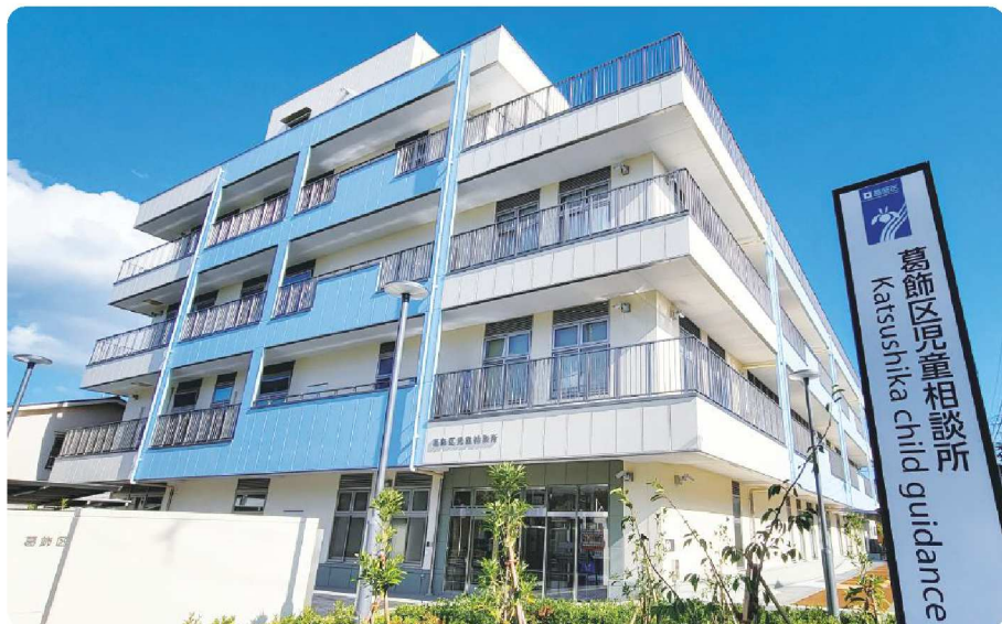
葛飾区児童相談所