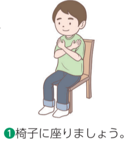
①椅子に座りましょう。