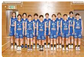
▲東京羽田ヴィッキーズ

日程：5月28日(日) 会場：水元総合スポーツセンター体育館 アリーナ 時間及び対象： 【1部】午前9時30分から午後0時30分(小学1～4年生) 【2部】午後1時30分から午後5時(小学5・6年生) 定員：1部・2部 合計180人