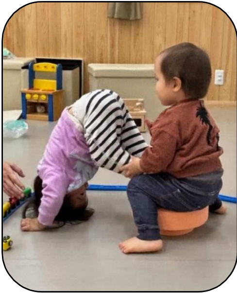
やんちゃな2才児が遊んでいます