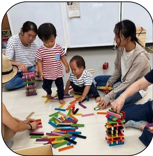
おもちゃで遊んでいます