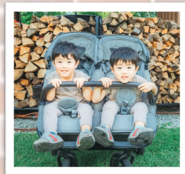
▶ハロウィンピクニック

多胎児を子育て中のファミリーを対象としたサークルです！ 東京都葛飾区周辺で交流イベントをしています。 プレママさんから、小学生以上の多胎児パパママさんも歓迎です！ メンバー登録(無料)していただくと、LINEグループにご招待します。 イベント情報の先行案内や情報交換をしています。