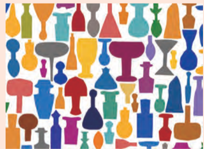
◀「かえでのチョコチョコキ」(楓さん作)