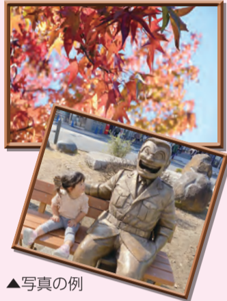
▲写真の例 ©秋本治・アトリエびーだま/集英社

皆さんからお寄せいただいた写真は、選考の上、広報かつしかや区ホームページなどに掲載する予定です。