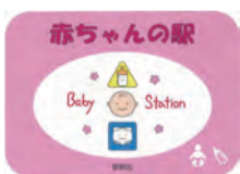
▲ステッカー ▲のぼり旗

乳幼児を育てる方が、外出時に気軽に授乳やおむつ替えなどを行える「赤ちゃんの駅」を、区内施設に設置しています。赤ちゃんの駅がある施設には、のぼり旗・ステッカーを掲示しています。