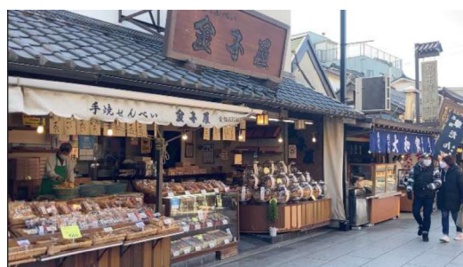
図7 商品を作りながら参道に目配りも