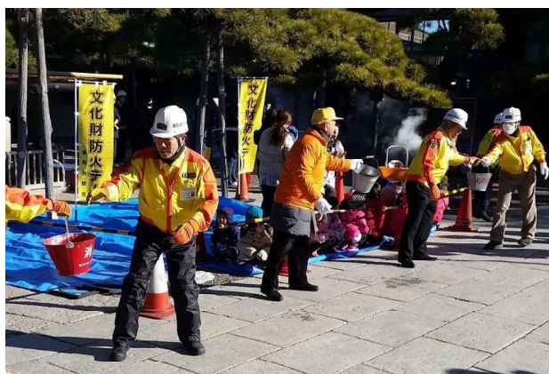
図15 文化財防火デーの様子 毎年1月に帝釈天題経寺境内でバケツリレーや防火訓練が実施されている。

レジリエンスとは、逆境や困難から自律的に立ち直る力を指す言葉であり、地域の災害レジリエンスとは、予防、災害時対応、災害後の復旧等を包括的に含んでいる。また、地域の災害リスクに対する情報を共有しながら、「壊れない」という発想に加えて「壊れにくい場所を確保する」、「壊れても命が守られる」、「壊れても直しやすい」、「直している過程でも一定水準の生活を確保できる」といった中間的な考えを含め、その方法にも、既存のものを上手に用いる（井戸、水路等）、既存のリスクを個々人の意識向上と協力によって減じる（タ