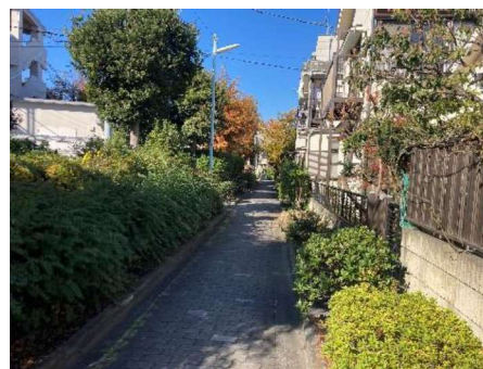
図10 柴又用水跡の緑