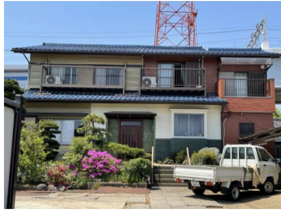
図16 水害に備え、敷地をかさ上げた江戸川土手沿いの旧家

例えば、葛飾柴又の第2のリング、第3のリングに広がる住宅地に一定の農地を確保することにより、延焼防止帯の確保、安全な避難路の確保、緑被率の増加、美しいまち並みの形成、歴史文化の継承といった多面的な効果を期待することができる。危険なブロック塀を生垣に変えることも同様である。神社に多く見られるイチヨウや、生垣に多用されているイヌマキは、防火効果を持つ樹木である。イチイ、ネズミモチ、アジサイ等も同様である。