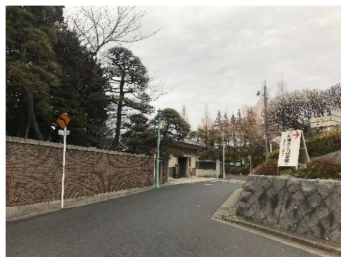
図5 国分道（南側ルート） 江戸川土手を正面に、左手は山本亭、右手方向に進むと葛飾柴又寅さん記念館に至る大切な回遊ルートを形成している。