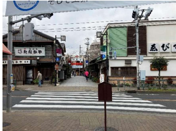
図 11 帝釈天題経寺側から見た帝釈天参道交差点

舗装やストリートファニチャー等、現代的なデザイン手法によって連続性を演出し、分断を和らげる工夫を施すことも一考であるが、そのデザインプロセスにも帝釈天題経寺参道に日々関わる人々の意見が十分に反映されることが大切である。