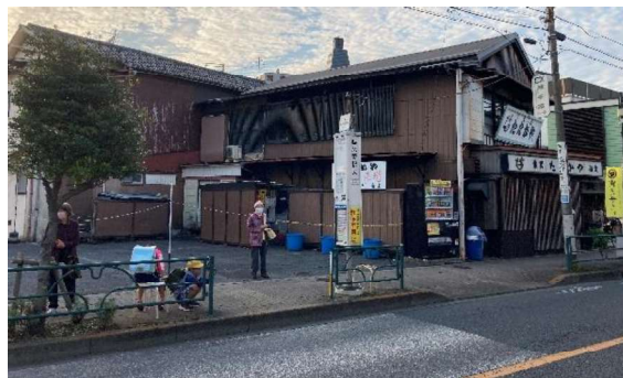
図 12 帝釈天参道交差点付近にはバス停があり重要な交通拠点でもある。