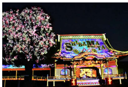
図1 プロジェクションマッピング