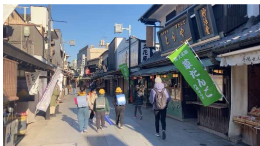
図6 参道を帰宅路とする小学生

放課後になると、帝釈天の参道には「ただいま〜！」と元気な小学生の声が響く。これも、1階の店先を広く開放して対面販売を行っている、ここならではの光景である。自動ドアやショーウィンドウを構えた店舗やマンションでは生み出せない、地域の人々の交流が日々育まれている。