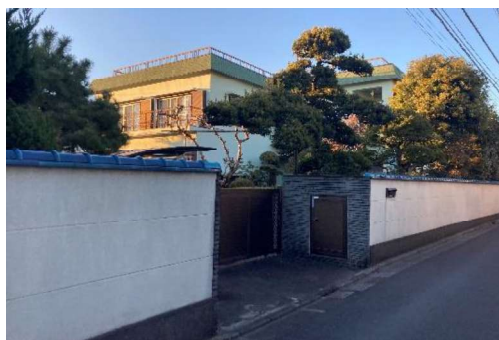
図9 旧家の敷地内にも多くの樹種が見られる

葛飾柴又は、木々をたどって歩けば、かつて農村であった歴史に触れることができる。古くからの道では、歩を進めるごとに生垣や樹木が現れる。旧家に由来する樹木が多く残り、スダジイのほか、クスノキ、イチヨウ、ケヤキ、クロマツ等変化に富んでいる。また、柴又用水跡は、両側の敷地の庭木も含めて、緑豊かな空間が形作られている。