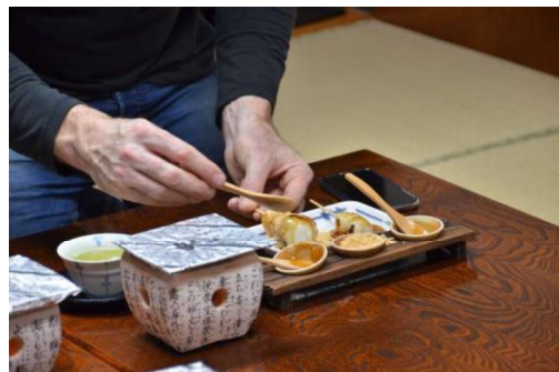
図14 和菓子作り体験

生業の活性化においては、関係課との協力の下、商業、農業、観光等のそれぞれに関し、必要な支援に取り組む必要があるが、文化的景観の視点からは、伝統的には縁日と屋台、近年においては前述の実行委員会の取組や、参道におけるユニークベニューの開催のように、歴史的な場所（社寺境内、道等）、伝統的な活動（祭礼、年中行事等）、特産品（川魚料理、草だんご、煎餅、佃煮等）、観光等が相関性を持つような催しの促進に重点を置く。まち巡りや河川敷でのスポーツやレクリエーションと食体験や体験型の事業を合わせることもその一例である。