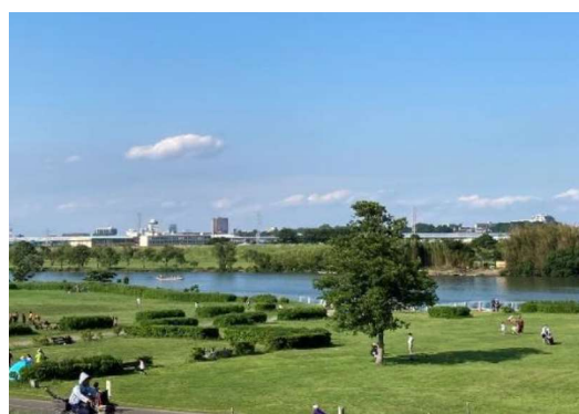
図18 江戸川土手からの河川敷、江戸川、対岸の下総台地の眺め

併せて、新八水路や矢切の渡しのように、近年ではその歴史的意義に対する関心が薄らいでしまったもののPRや整備に努め、これらを回遊ネットワークの中に取り入れる等、葛飾柴又の成長における川の重要性と可能性に対する多様な気付きへと繋げていく。