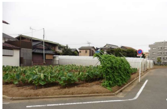
図17 農地は、都市においては防災上重要なオープンスペースとされる。

とりわけ、かつての農村風景の中に備わっていた様々な水害や火災、地震等への知恵を再認識し、地域における農地や旧家の重要性に対する意識や理解を高め、多面的に地域づくりに資する農業景観の保全を図る。また、この取組を通じて都市内農地の継承を図るための人づくり、体制づくりに取り組む。