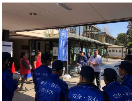
図 2 3 月 9・10 日の記念イベント 実行委員会を中心に地元と行政の協働によって実施された。

平成 30 年度には 4 万 8 千人の来場があった。令和 2 年度は新型コロナウイルス感染症拡大の影響を受けた柴又観光回復の一助とするべく、予防対策に万全を期して開催した。AR を活用して幅広い層が 3 つのリングを柴又の歴史や文化について学びながら、楽しく回遊でき、コロナ禍でも安全に柴又散策を満喫できることをアピールし、「新たな生活様式」における観光への提案ともなった。