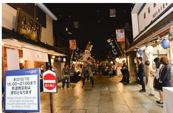
図 4 Tokyo ユニークベニューショーケースイベント

令和元年 10 月には、帝釈天題経寺とその参道を会場として「Tokyo ユニークベニューショーケースイベント 2019～TOKYO GO Local～」が開催された。東京都は M I C E 誘致の一環として平成 26 年度よりユニークベニューの普及に取り組んでおり、公益財団法人東京観光財団に委託して東京のユニークベニュー