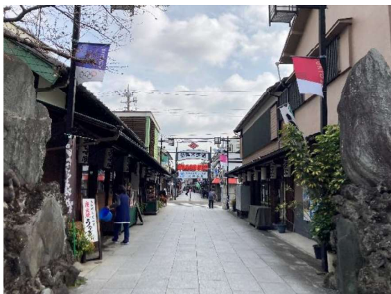
図 13 参道入口から帝釈天参道交差点方向への眺め