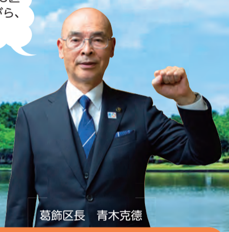
葛飾区長 青木克徳

下記の施策の他、「子どもを産み育てやすい環境づくり」「健康寿命の延伸」「公共交通網の充実」を重要施策として推し進めます。今後も区民の皆さまの声をしっかりと聞きながら、全力で取り組んでまいります。