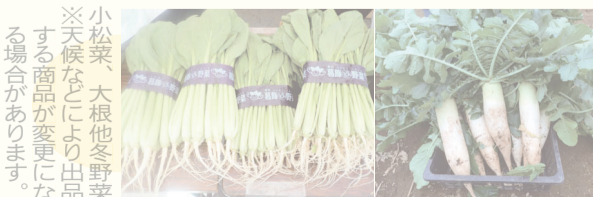
※小松菜、大根他冬野菜。天候などにより出品する商品が変更になる場合があります。