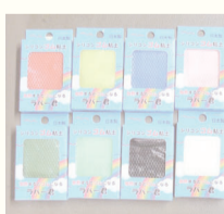
「シリコンゴム粘土「ラバー君」」