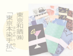
「東京和晒(株) 東京本染手拭」