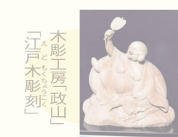
「木彫工房政山「江戸木彫刻」」