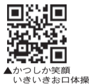
▲かつしか笑顔 いぎいきお口体操