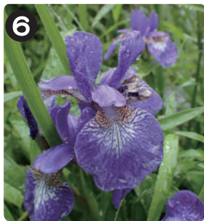
5/13 アヤマ 水元かわせみの里の営巣壁付近で咲いていた。花はカキツバタやハナショウブとよく似る。