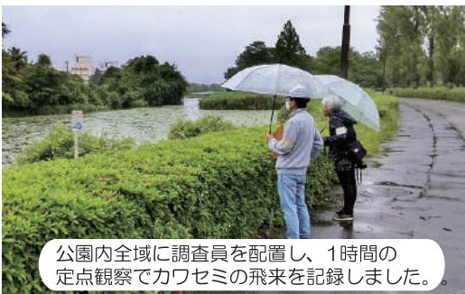
公園内全域に調査員を配置し、1時間の定点観察でカワセミの飛来を記録しました。

5月7日(日)に、第2回目となるカワセミ個体数一斉調査を実施しました。結果、3羽は確実に5羽が息していることが推測され、今の水元公園には、前回(同年1月22日)の調査結果である6~7羽より少ない数が息しているということが判りました。