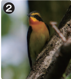
5/9 キビタキ バードサンクチュアリで見られた。木の高い所で、美しい声で鳴いていた。