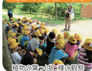
植物の葉っぱと種の観察

水元小合溜周辺の身近な生きものや、環境、歴史について楽しく学びます。水質浄化センターの見学なども可能です。