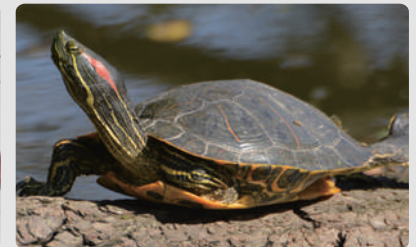
ミシシippアカミミガメ