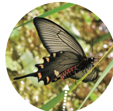
お腹に赤い筋模様