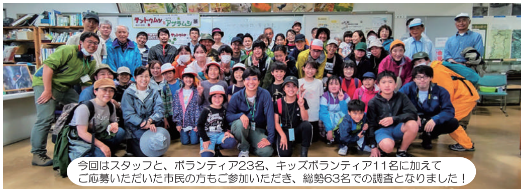
今回はスタッフと、ボランティア23名、キッズボランティア11名に加えてご応募いただいた市民の方もご参加いただき、総勢63名での調査となりました！