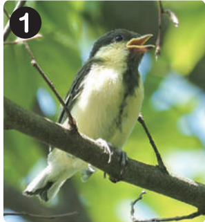
5/6 シショウカラの幼鳥 水元かわせみの里に設置した巣箱から巣立った。