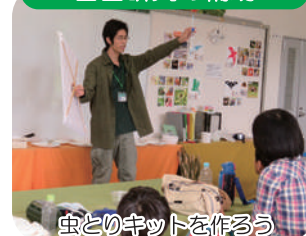
虫とのキットを作る

水辺の生きもの調査、図鑑作りなど、様々な内容の自由研究のイベントを行い、夏休みの児童への、学習のサポートをします。