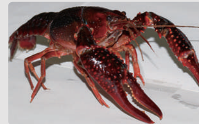
アメリカザリガニ

しかし、連れてこられただけの外来種であるアメリカザリガニやアカミミガメに罪があるわけではありません。私も子どものころ、近所の公園でザリガニ釣りをしたり、水辺で日向ぼっこをしているアカミミガメをただ眺めたりした時間を、楽しい思い出として今なお覚えています。彼らは良き遊び相手であり、今でも大好きな生きものです。しかしこれからは、その付き合い方を変えていく必要があります。日本の環境を守るため、せめて今いる水辺からは移動させないように、飼うのであれば最後まで愛情をこめて飼育し決して逃がさないよう、皆で協力していけたらと思います。(野間)