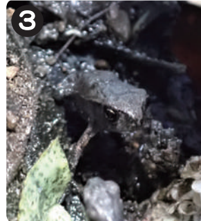
5/13 アズマヒキガエルの幼体 水元かわせみの里カエル池近くで見られた。体長1cm前後。