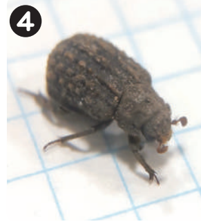
4/30 ヒメコブスジコガネ 動物の糞や死骸、鳥の羽などを食べる糞虫の一種。タヌキの溜め糞に潜り込んでいた。