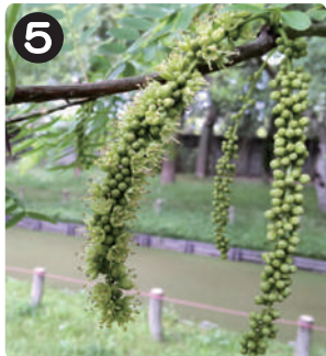
5/12 サイカチ キャンプ場近くで咲いていた。開花期間は一週間と非常に短い。