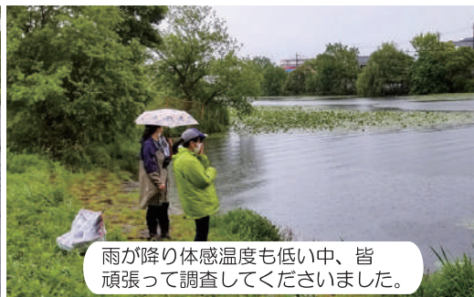
雨が降り体感温度も低い中、皆頑張って調査してくださいました。