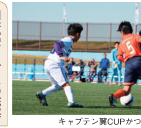
キャプテン翼CUPかつしか