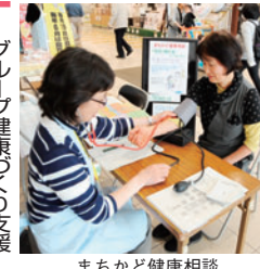
まちかど健康相談