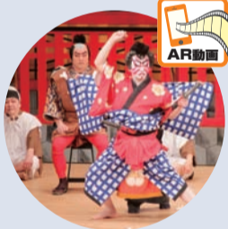
中津川市・下呂市「地歌舞伎」

下の写真にスマートフォンなどのモバイル機器をかざすと、地域芸能やサミット参加地域の特産品などを動画で見ることができます(AR動画の使い方などは区ホームページを参照)。