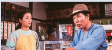
第35作「男はつらいよ 寅次郎恋愛塾」