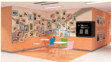
ミュージアムホールイメージ (イメージCG提供:松竹株式会社)