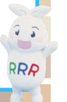
葛飾区ごみ減量・3R推進キャラクター(Ree)ちゃん