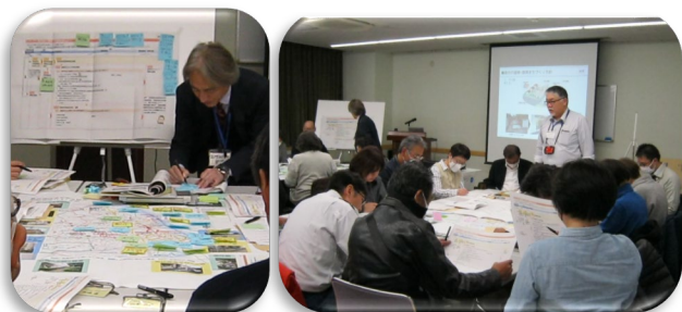
↑グループワークの様子

第2回訓練にて実施した班ごとに、被害が予想される箇所、地区の復興で重要となる課題や残して利活用したい資源などを話し合いました。