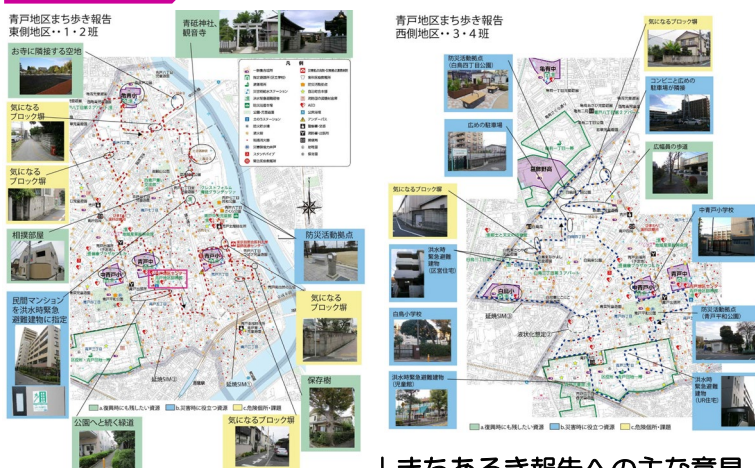
↓まちあるき報告への主な意見