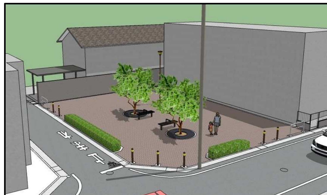
イメージ図 (パース)