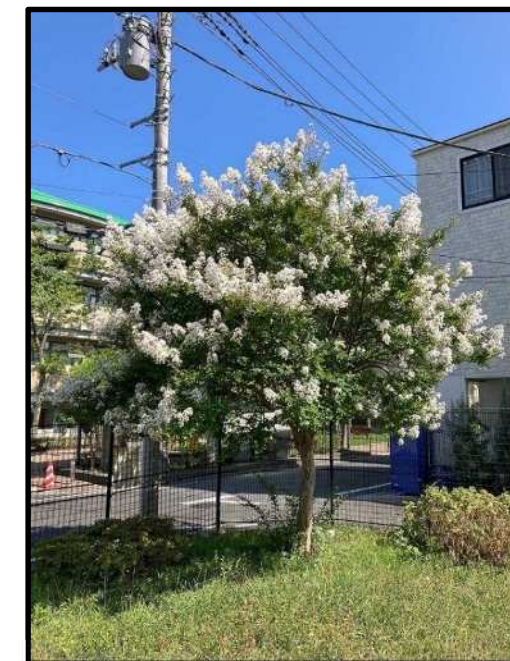
緑陰木のイメージ(サルズベリ)