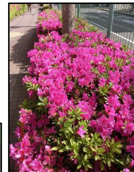
低木のイメージ (オオムラサキツツジ)