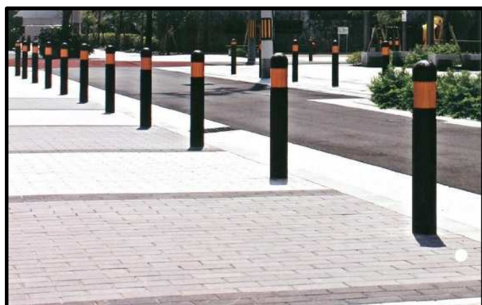
車止めのイメージ