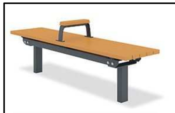
ベンチのイメージ