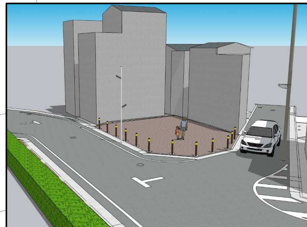
イメージ図(パース)