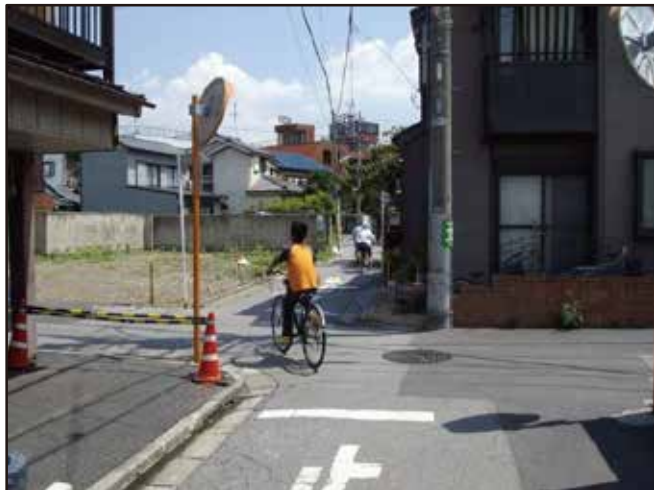
北西道路南区間(工事前)