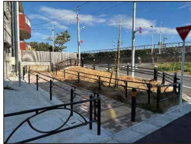
南北道路C (ポケットパーク)