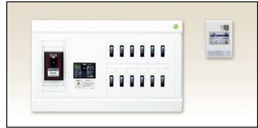
分電盤タイプ (感震リレー外付型)