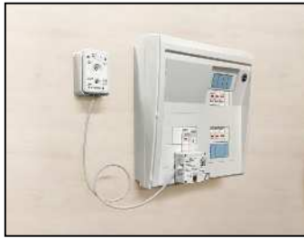
時間設定タイプ (分電盤型)