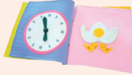
布絵本「まる」

●大活字本・朗読CD・布絵本など 小さな字を読むのが困難な方や、目が自由な方も楽しんでいただけます。