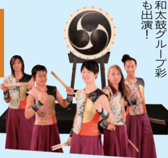
和太鼓グループ彩も出演!