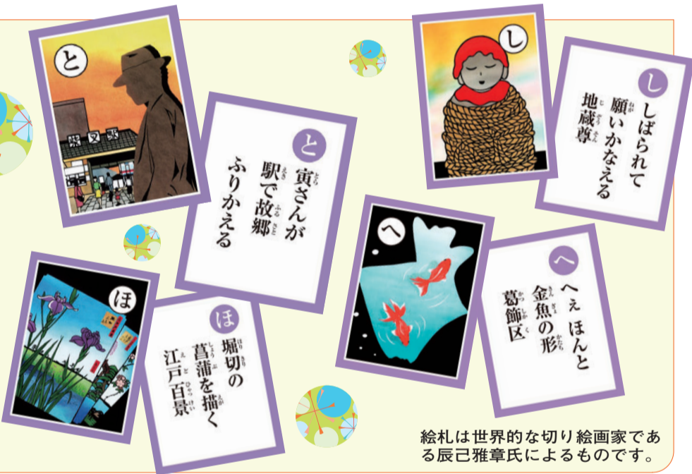
絵札は世界的な切り絵画家である辰己雅章氏によるものです。