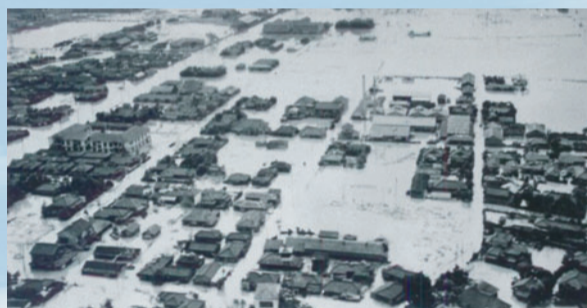
昭和22年のカスリーン台風で浸水した亀有付近の様子