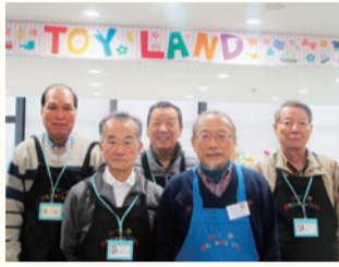
▲おもちゃ病院トイドクターの皆さん

日々ですが、子どもたちの笑顔を見たときや、思いの詰まったおもちゃが動き出した瞬間はとても嬉しく思います。何より、私たち全員おもちゃが好きなので、皆さんに長い間大切にしていただけけるよう、これからも活動を楽しみながら続けていきたいです」と話してくれました。