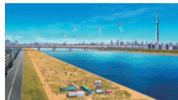
▲放送シーン の1場面

堀切大凧揚げ大会は、アニメ『名探偵コナン』平成27年1月24日・31日放送「堤無津川凧揚げ事件」で、舞台参考の1つになりました！