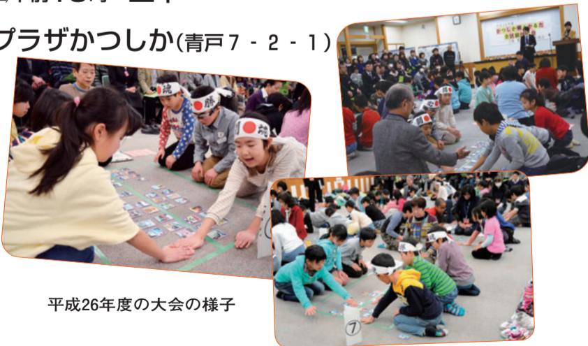
平成26年度の大会の様子