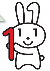
マイナンバーキャラクター マイナちゃん

個人番号カードは、マイナンバー・住所・氏名・生年月日・性別などが記載された、公的な身分証明書として利用できる顔写真付きのICカードです。平成28年1月下旬から、申請者に対して個人番号カードの交付が始まります。