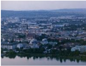
オーストリア ウィーン市フロリズドルフ区 Floridsdorf City, Vienna, Austria