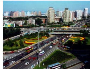
中国 北京市 豊台区 Feng Tai City, Beijing, China