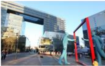
かんこく 韓国 ソウル特別市麻浦区 とくべつし まぼく