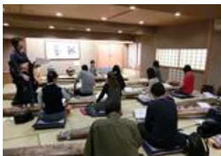
日本文化体験/ Japanese Cultural Experience

葛飾区に住んでいる外国人と日本人が楽しく交流できるイベントがあります。国際交流に興味がある人みんなが楽しめるイベント「かつしか国際交流まつり」、生け花や箏などの日本文化を体験できる講座、外国の食文化、伝統文化、ダンスなどを体験できるワークショップなど、楽しいイベントがいっぱいです。くわしくは、かつしかシンフォニーヒルズ情報紙「ミル (MIL)」やホームページ ( https://www.k-mil.gr.jp/kie/index.html ) を見てください。