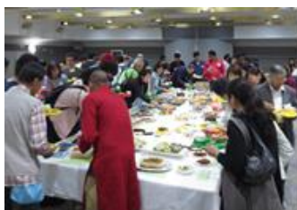
ポットラックパーティー/Potluck Party

For details, please check Katsushika Symphony Hills information bulletin ‘MIL’ and our homepage ( https://www.k-mil.gr.jp/kie/index.html ) .