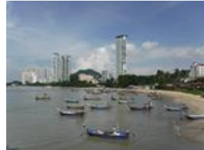
マレーシア ペナン州 しゅう