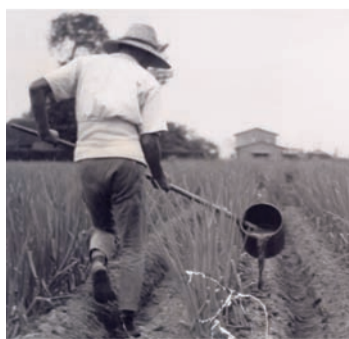
ネギ作りでの施肥の模様(昭和20年代、金町)

江戸時代、江戸周辺の農村の役割は、江戸の町に野菜などの食糧を供給すること、町の生活廃棄物を「肥やし」という形で使い、環境を衛生的に保つことでした。特別展では、この10年で発見された新しい資料をもとに、江戸・東京と近郊の農村の下肥を通じた交流を明らかにします。葛飾の地域性を生かした先人たちの知恵をご覧ください。 都市と下肥 江戸の町から排出された人糞尿の取引方法や使い方を、古文書や関係者の証言などから明らかにします。 下肥の記憶 実際に下肥を使い、野菜を作っていた方の体験談から、下肥という肥料の便利どころ、苦心したところなどを紹介します。 下肥の未来 化学肥料や未来の農業の研究では「下肥的な」肥料が目ざされています。先人の生活の知恵である下肥を、これからの農業にどのように活用できるのかを紹介します。