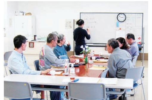
最近の出来事を思い出して発表するなど、記憶障害を改善するためのリハビリを行っています。

記憶障害や注意障害などを改善するために、メモの活用訓練や脳トレ、作業訓練などをグループで行います。