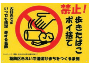
啓発プレート(縦21cm、横30cm)