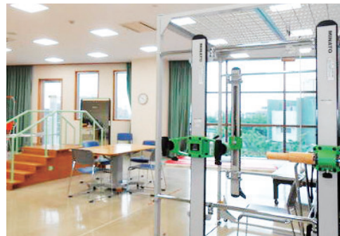
明るい機能訓練室で歩行訓練などのリハビリを行います。

体操や器具を使ったリハビリを行っています。一人一人の障害に合わせて、身体機能の維持向上をめざします。