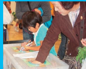
鉛筆のつかみどり