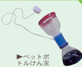
▶ペットボトルけん玉