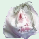
▲ハンカチで作る巾着袋