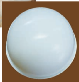
▲加工されたセルロイドは、きれいな球状になります

日 7月31日(金)午前9時30分～午後3時 会郷土と天文の博物館 対 小学5・6年生20人 費200円 方往復ハガキに「ゆしぼり」、参加者全員の住所・氏名(フリガナ)・学年・性別・電話番号を書いて、7月14日(火)(必着)まで(多数抽選)。