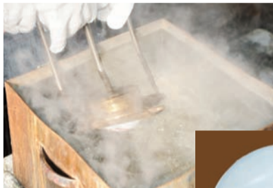
▲「湯絞り」は熱いお湯の中で、セルロイドを加工する技術です