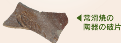
常滑焼の陶器の破片