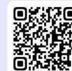
東京信用保証協会 HP

事業承継時に経営者保証がある既存の融資を経営者保証がない融資に借り換えてできる制度です。区の「事業承継特別保証借換融資」は、この制度に対応した、国の全国統一制度の対象です。ご利用にあたっては、事前に取扱金融機関にご相談ください。 https://www.cgc-tokyo.or.jp/institution/guideline_2024/index.html