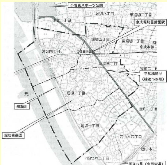
堀切一丁目～五丁目を含む約121haの区域です

勉強会では「防災」、「地域活性化」、「橋梁架替とまちづくり」の3テーマごとにグループをつくり「堀切地区まちづくり構想（案）」の作成に向けて、定期的に集まり、話し合いを行っています。