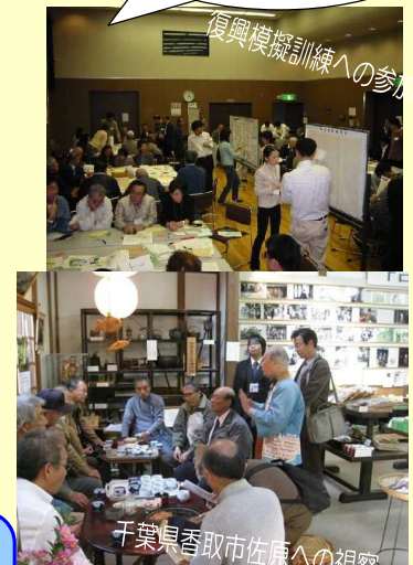
千葉県香取市佐原への視察

【募集】まちづくりを一緒に考えませんか？ 勉強会では一緒にまちづくりを検討して下さる方を募集しています。参加希望の方は裏面の連絡先までご連絡ください！