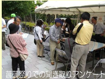
菖蒲祭りでの聞き取りアンケート