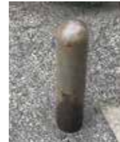
車止めなどの塗り直し