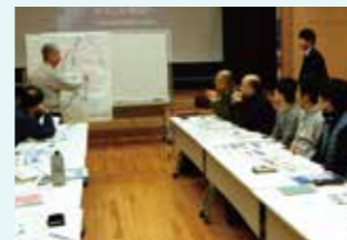
浦安市のみなさん