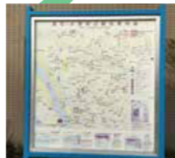
観光案内板の更新