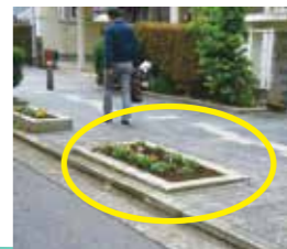
花壇を踏まれにくいように改善(花壇の縁のかさ上げ)