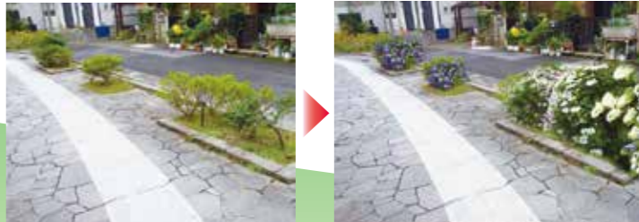
既存の花壇にあじさいの植樹