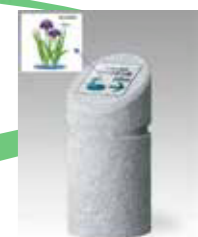
老朽化した車止めを更新