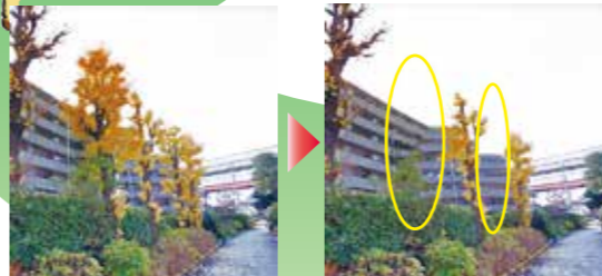
密集したイチョウの間伐