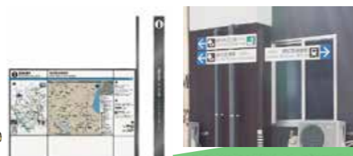
案内サインの増設