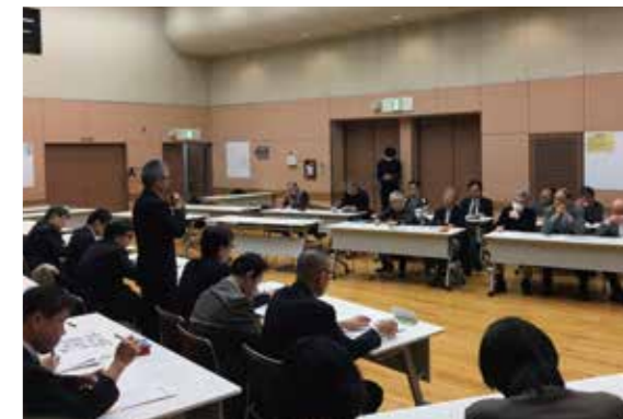
当日の様子 堀切地区センター3Fホールにて

また、協議会の活動成果や区によるまちづくりの報告の後、活発な意見交換が行われました。