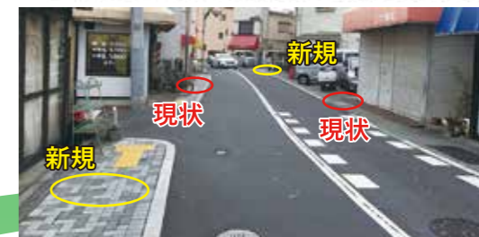
花菖蒲タイルを増設して菖蒲園まで誘導