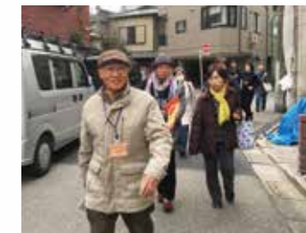
魅力スポットへ向かう皆さん