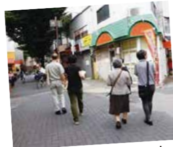
まちあるきによる調査

葛飾区では、町会・商店街・堀切地区まちづくり推進協議会と堀切地区の「賑わいのある道づくり」に向けた検討会を開催しました。 全6回の検討会を踏まえてまとめられた、取り組み方針などについてご紹介します。