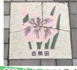
割れたタイルを取替+縁取りを分かりやすく