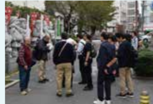
雑司ヶ谷・南池袋まちづくりの会のみなさん

当日は、整備対象路線の見学と「地域住民と行政の協働型まちづくり」の取り組みを紹介した後、まちづくりについて意見交換を行いました。