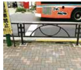
ガードパイプを景観に配慮した色に統一