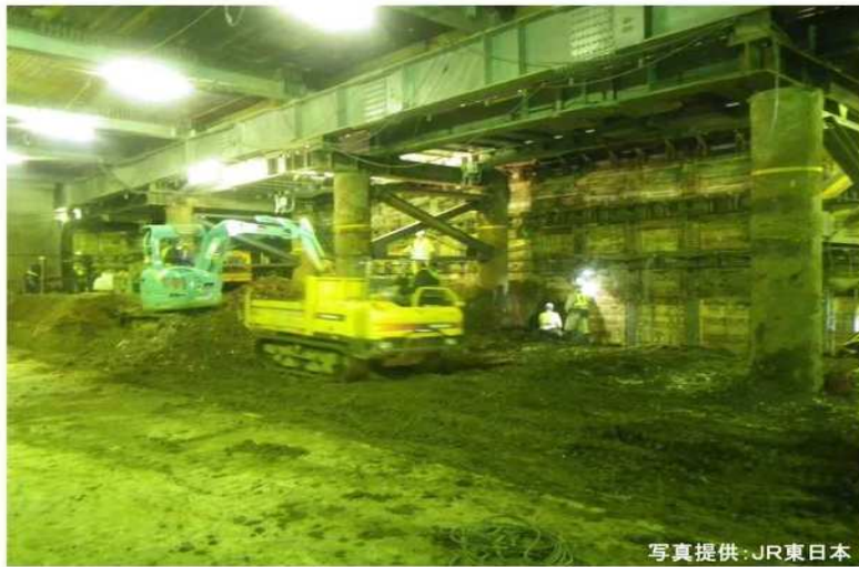
平成29年2月撮影 快速線下掘削状況