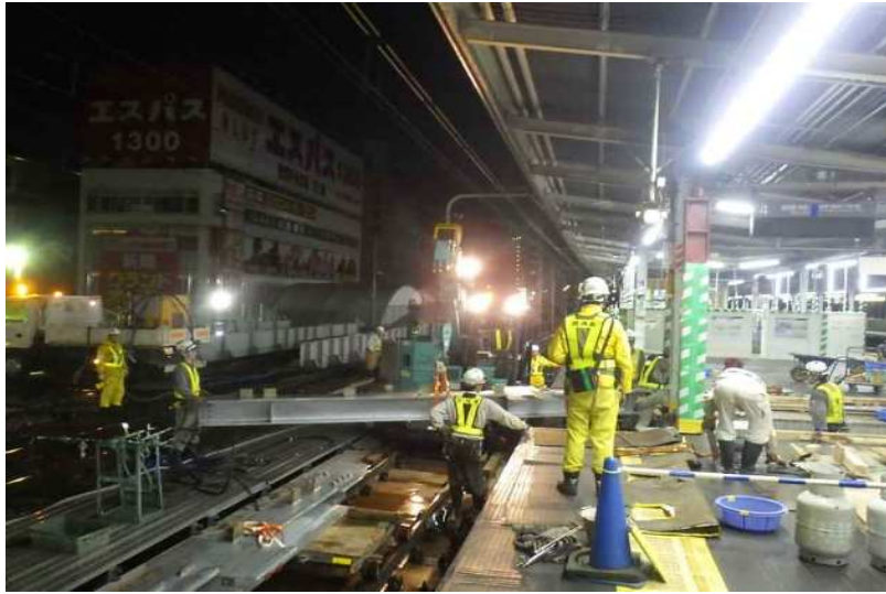
平成28年5月撮影 ホーム受替え工