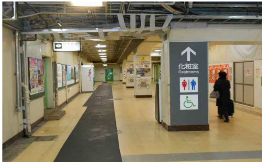
平成27年1月23日撮影 駅構内南口側に配管設備工事の仮囲いを撤去