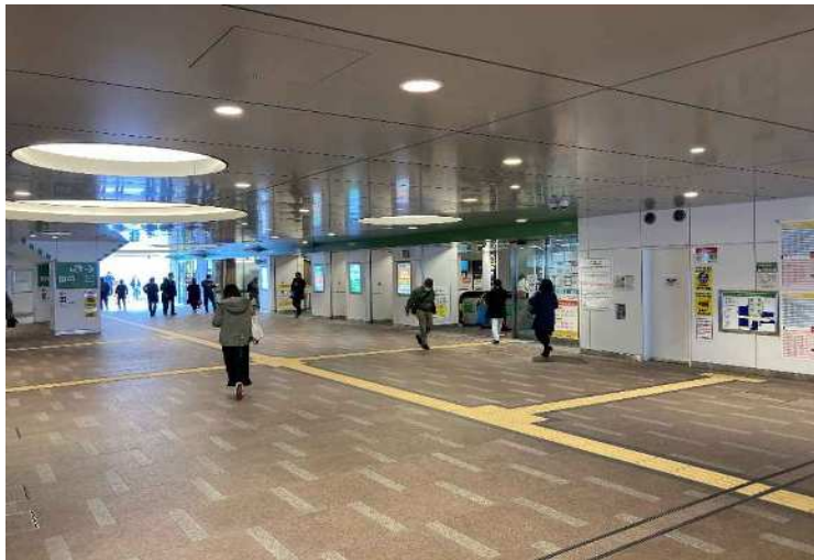
令和3年3月撮影 暫定開通した自由通路の様子