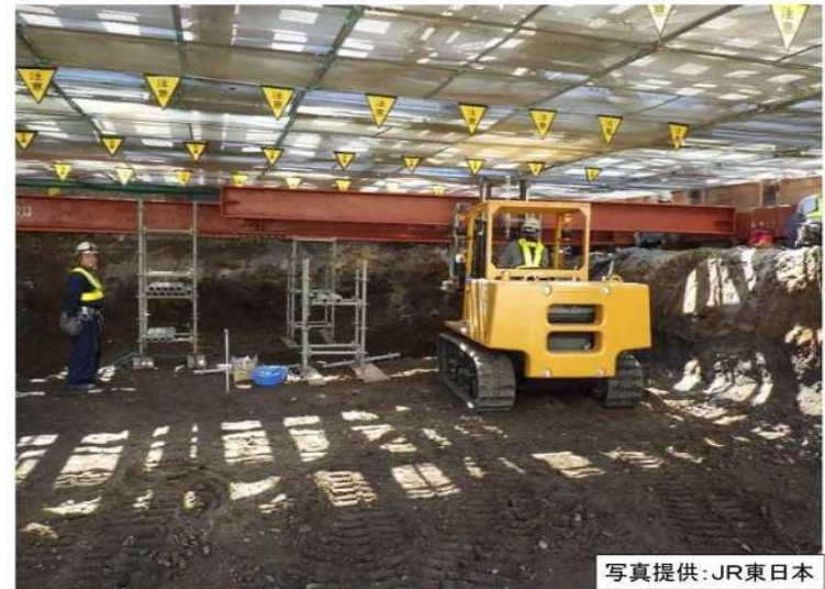
平成28年5月撮影 貨物線下掘削状況