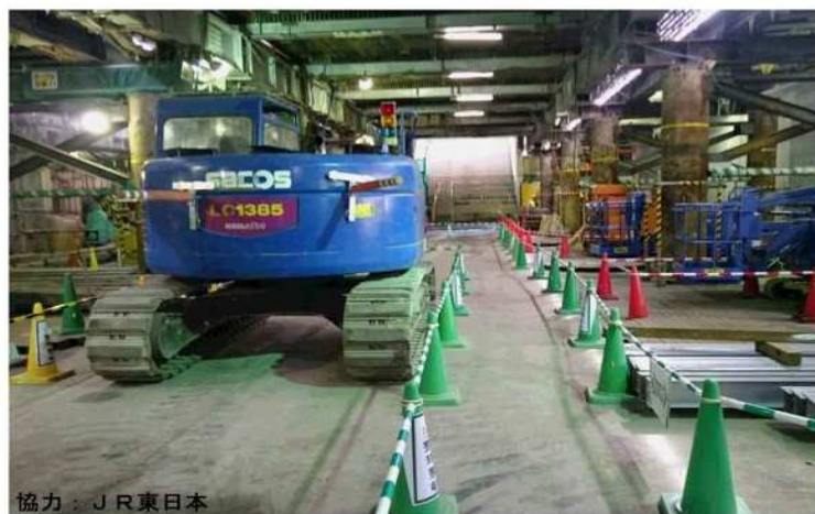
平成29年4月撮影 掘削工事が完了した快速線下の様子