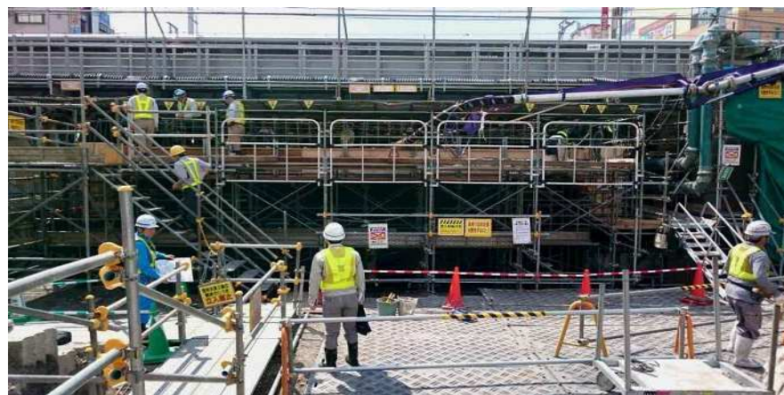
平成29年5月撮影 ボックスカルバート上床版コンクリート打設状況確認