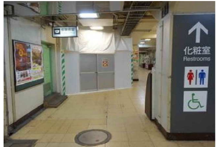
平成26年10月21日撮影 駅構内南口側に配管設備工事の仮囲いを設置