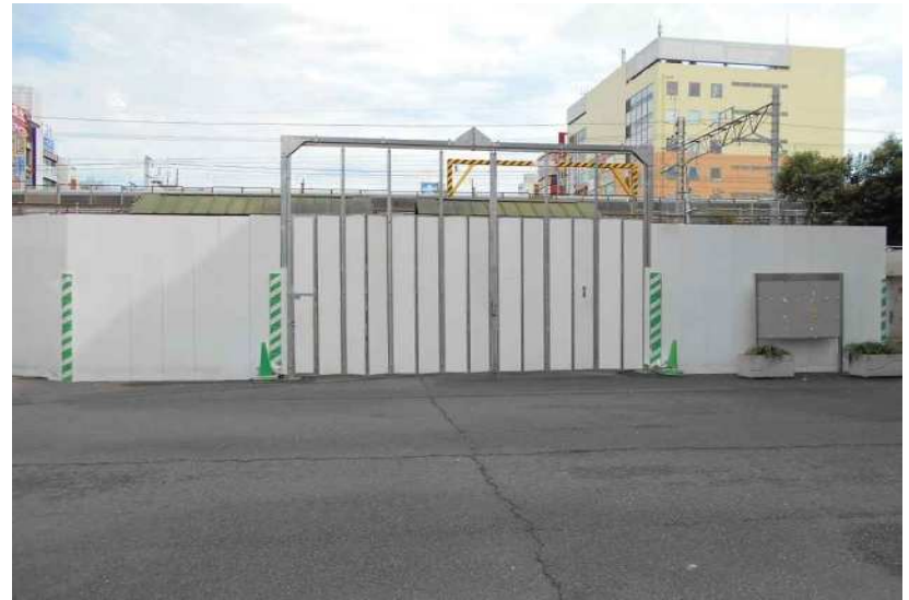
平成28年8月撮影 北口仮囲いの設置