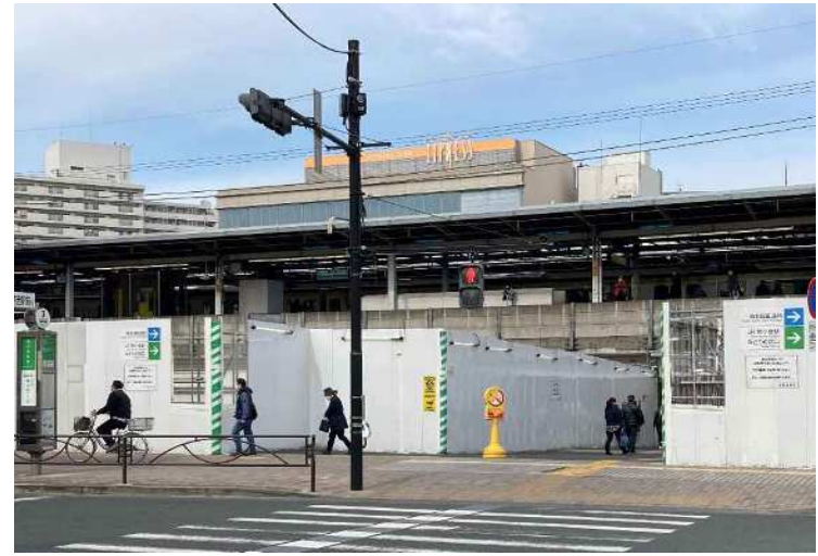
令和3年3月撮影 暫定開通した自由通路の様子(南口駅前広場側から臨む)