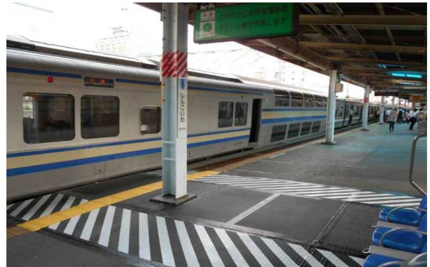
平成26年7月2日撮影 快速線ホーム(一部)のかさ上げ