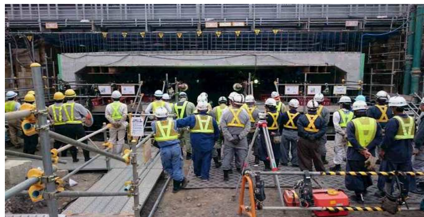
平成29年6月撮影 ボックスカルバートジャッキアップ施工状況確認