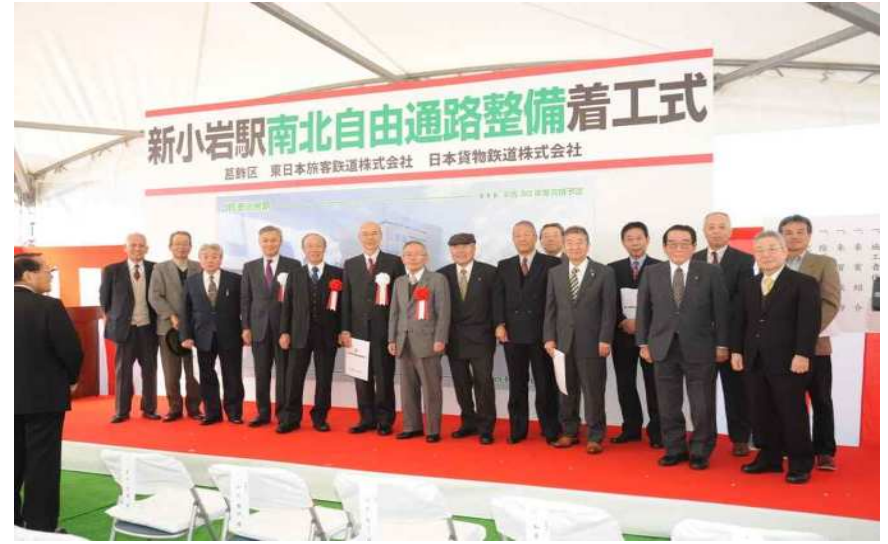
平成25年12月21日撮影 着工の様子