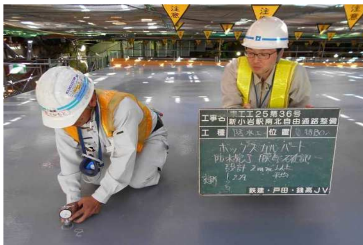
平成29年5月撮影 ボックスカルバート上床版防水スプレー塗布状況確認