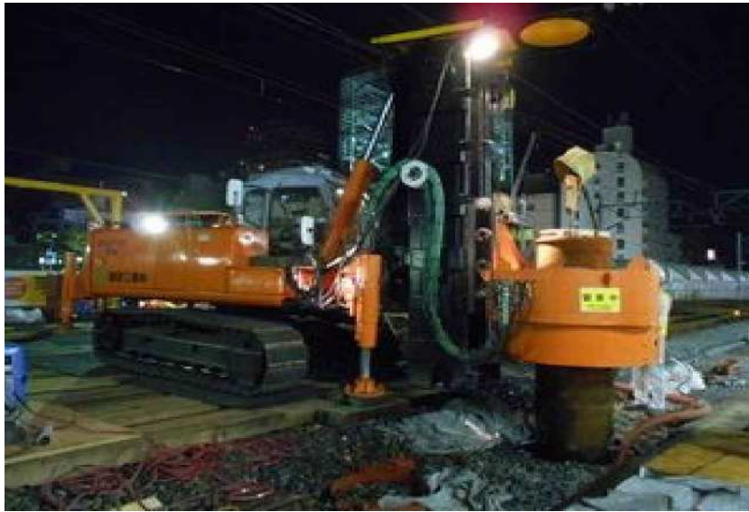
平成26年9月19日撮影 快速線工事桁の鋼管杭打設