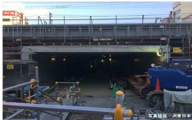
平成29年9月撮影 ボックスカルバートの床・壁等の躯体の構築