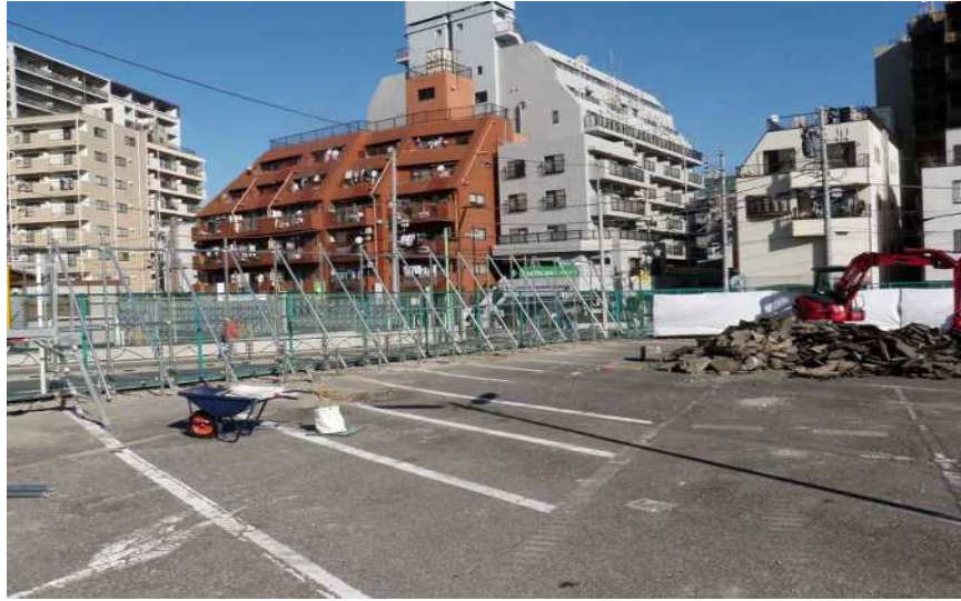
平成25年12月13日撮影 作業ヤード整備中