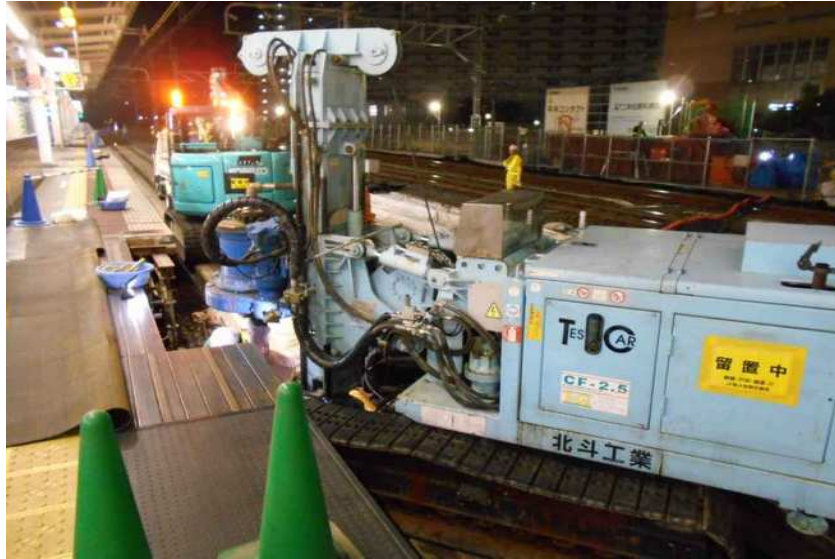
平成27年5月撮影 快速線工事桁の鋼管杭打設