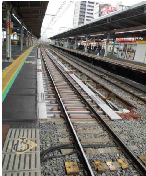
平成28年2月撮影 快速線(上り側)に設置された工事桁