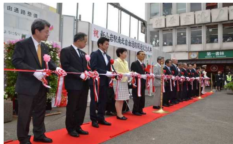
平成30年6月17日撮影 開通記念式典の様子