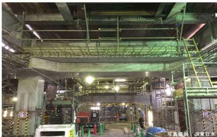
平成29年9月撮影 新設高架橋の柱等の構築工事