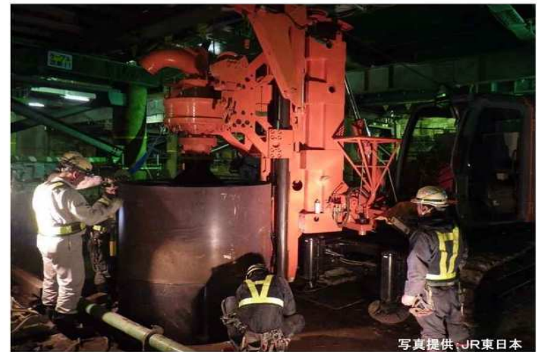
平成29年2月撮影 快速線下場所打ち杭施工状況