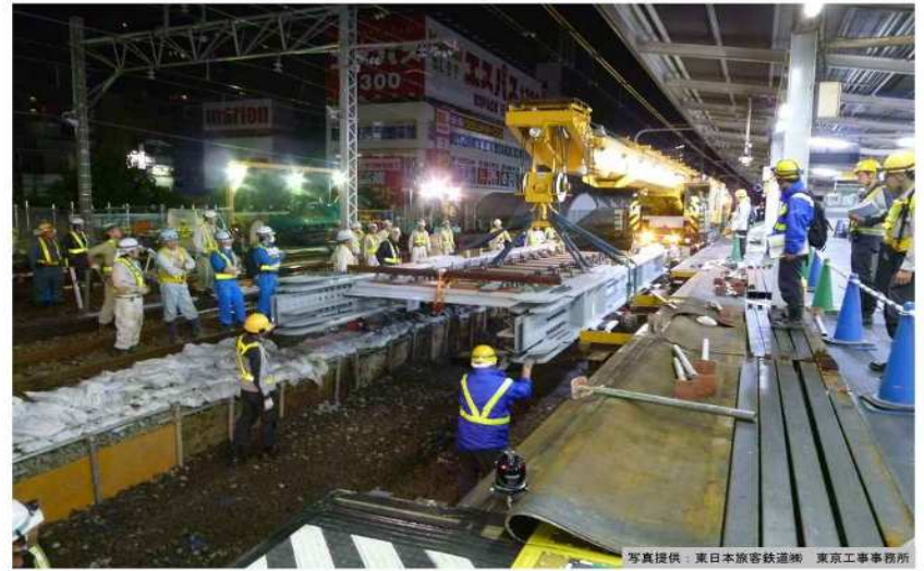
平成27年11月撮影 快速線(下り側)工事桁架設工