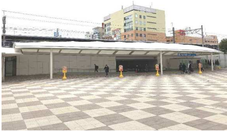
令和3年3月撮影 暫定開通した自由通路の様子(北口駅前広場側から臨む)