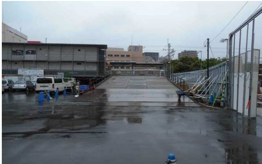
平成26年5月15日撮影 作業ヤードに工事用通路(工事車両用のスロープ)完成