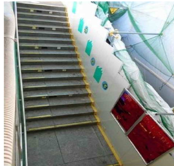
平成27年1月23日撮影 緩行線(各駅停車線)東京方の階段壁撤去工事