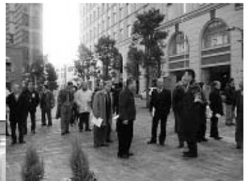
汐留地区 (イタリア街)