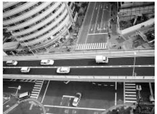
新小岩陸橋（たつみ橋交差点付近）

第五建設事務所（東新小岩1-14-11）の敷地内にあるインフォメーションセンターでは、平日の9時から12時、13時から17時まで工事情報の提供を行っています。