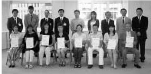
ニッセイ財団贈呈式 (右端・岩城部会長他2名)