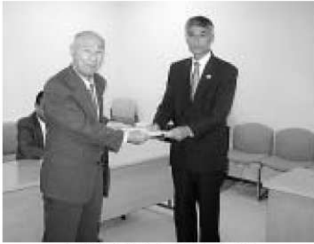
平和橋通り無電柱化の要望 (餌取会長代行、東京都第五建設事務所長)