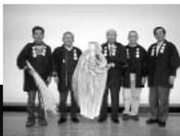
大玉飾りを披露する協議会の役員

また、年末年始には、昔からの名産であった伝統の大玉飾りを地元の玉飾り職人の協力で製作し、提灯イルミネーション中央部に飾りました。