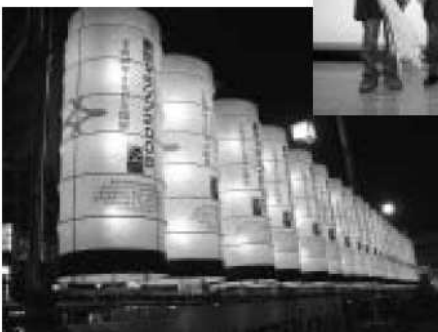
提灯イルミネーション