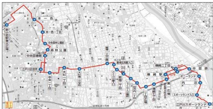
篠01系統区役所線路線図