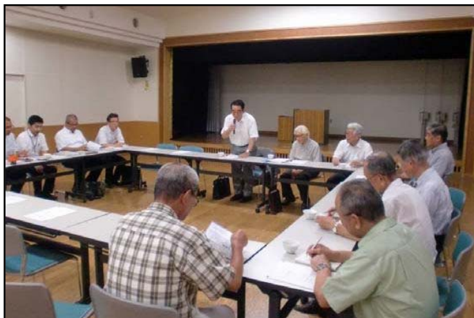
第1回新小岩駅東北地区まちづくり勉強会の様子

また、まちづくりの具体化策を話し合い・合意していくために、検討組織のあり方について方向付けを行う予定です。