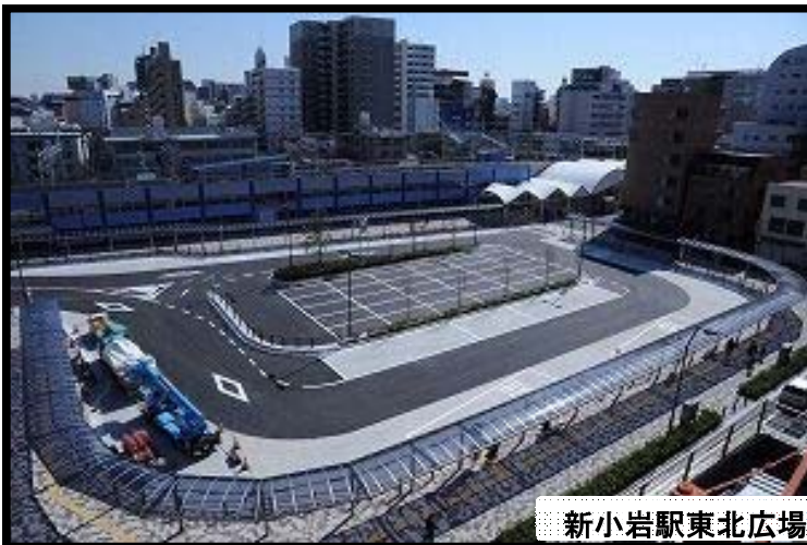
新小岩駅東北広場

さらに、平成 24 年 5 月 28 日には、スカイツリー開業に合わせて、新小岩駅東北広場のバス停からスカイツリータウン前経由浅草寿町行きの新規バス路線の運行が始まりました。