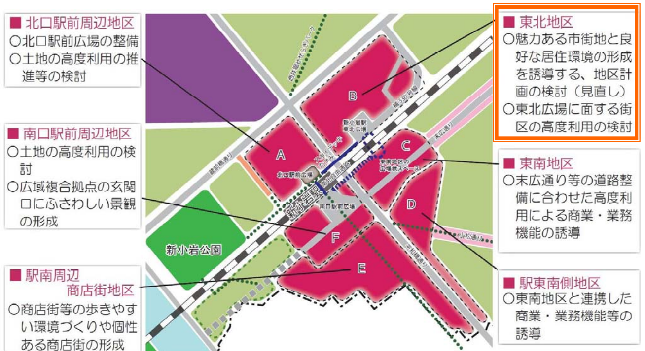
新小岩地域まちづくり基本構想における東北地区の整備方針

まちづくり基本構想は、まちの抱える課題を整理し、都市基盤施設や駅周辺の商業等の機能、土地利用など、総合的な将来像を描くものです。本基本構想において、東新小岩一丁目の約8.8haを対象とする新小岩駅東北地区（以下、東北地区）は、「魅力ある市街地と良好な居住環境の形成を誘導する、地区計画の検討（見直し）」「東北広場に面する街区の高度利用（高層建築物等による土地の立体的な有効活用）の検討」が整備方針として示されています。