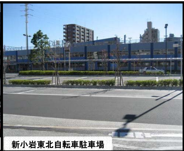
新小岩東北自転車駐車場