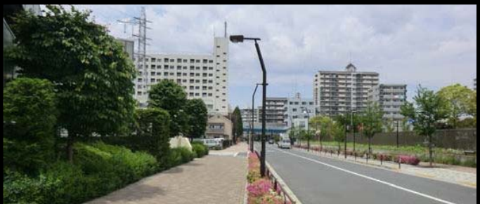
ゆとりのある道路空間(私学事業団総合運動場前)