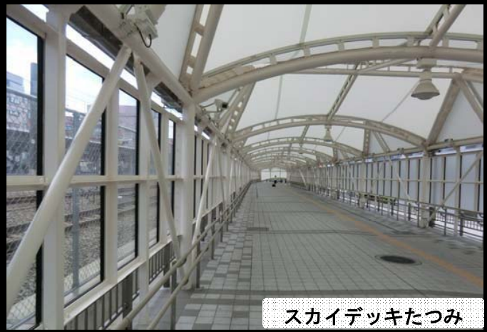
スカイデッキたつみ