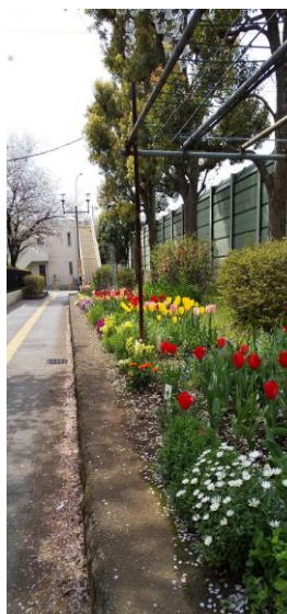
青小正門前の花壇

創立 70 周年を花で盛りあげたいと、頑張っています。雑草取り大変なので皆さん手伝ってくださいーい。