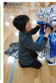
学芸会ゆかた着付け

子どもたちの様子が見られて楽しかった。応援団はいろいろな活動をしてきていることがわかりました。