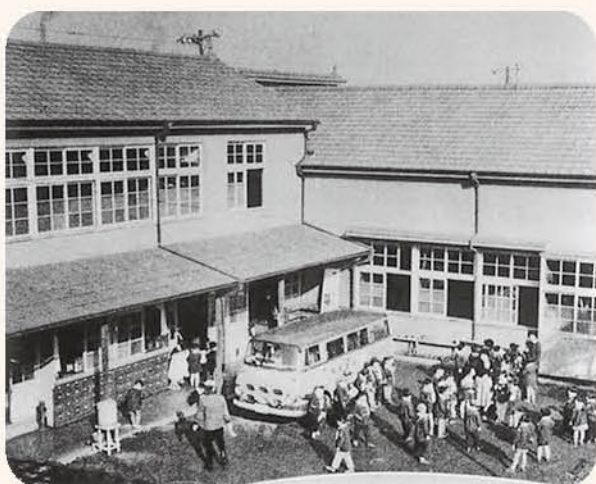
1957(昭和32年) 幼稚園の様子