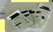
感熱紙(レシート等)