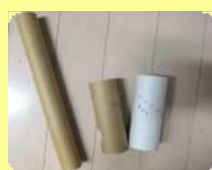
トイレトペーパー、ラップの芯