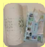
水に溶けないもの(キッチンペーパー等)