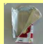
銀コーティングされているもの(ガムの包装紙等)