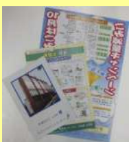
パンフレット、ポスター、チラシ