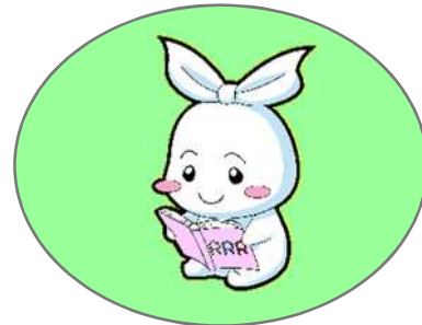
葛飾区ごみ減量・3R推進キャラクター