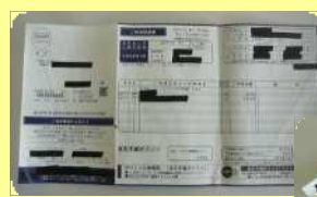
圧着ハガキ(親展ハガキ等)