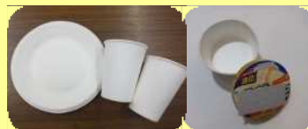
防水加工等されているもの(紙コップ、アイスクップ等)

特殊加工されたもの、食べ物等の汚れや洗剤等の強い臭いがあったものは、資源になりません。「燃やすごみの日」にお出してください。