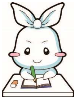
葛飾区ごみ減量・3R推進キャラクター リー（Ree）ちゃん

かつしかエコライフプラザでは、講座のほかに、ECOエコフェスタや洋服交換会などのイベントも開催しています。