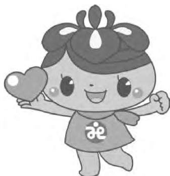
社協キャラクター「アエナちゃん」