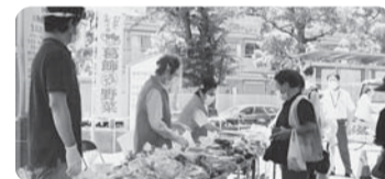
▲元気野菜即売会の様子

農作物の出荷に影響を受けた農業者を支援し、消費生活を活性化するために、JA東京スマイルと協働して「葛飾元気野菜販売促進キャンペーン」を開催し、諸費用の一部を助成します。