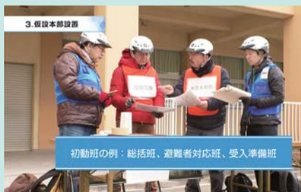
初動時の例：総括班、避難者対応班、受入準備班