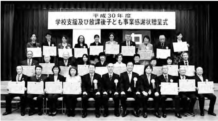
被贈呈者の皆さん