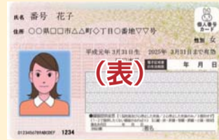
マイナンバー(個人番号)カード